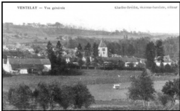
Ventaley dans la Marne

Incorporé au 40e régiment d'artillerie le 16 novembre 1902. Passé au 25e régiment d'artillerie le 1er octobre 1903.