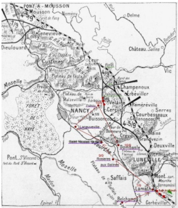
Combat devant Nancy

Incorporé à compter du 9 octobre 1913. Arrivé au corps le 10 octobre 1913 et soldat de 2e classe le dit jour.