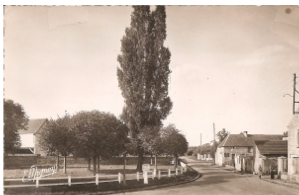
Place de la liberté. Le peuplier a été planté après