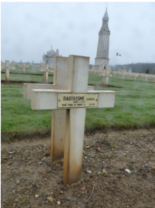
Nécropole Notre Dame de Lorette