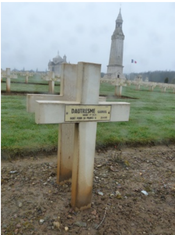
Nécropole Notre Dame de Lorette