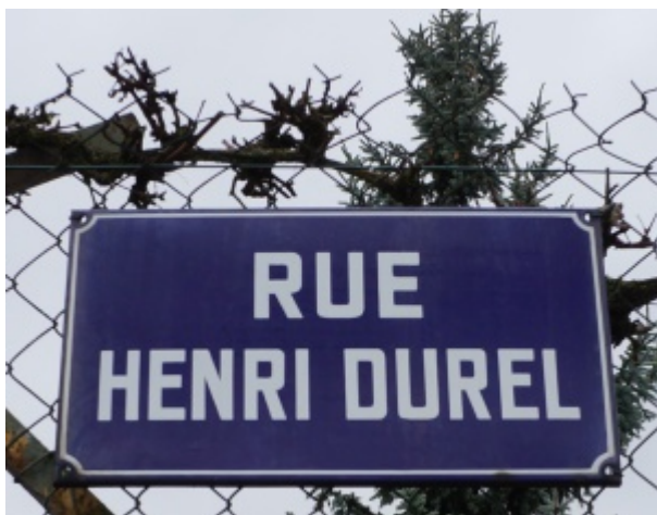
Rue Durel à Triel