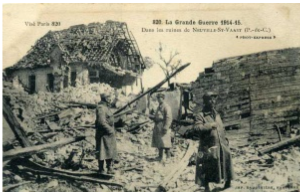
Dans les ruines de Neuville Saint Vaast (Pas de Calais)

Incorporé à compter du 5 septembre 1914. Arrivé au corps le 5 septembre 1914 et soldat de 2e classe le dit jour. Caporal le 26 décembre 1914.