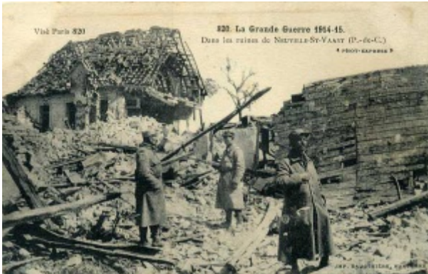
Dans les ruines de Neuville Saint Vaast (Pas de Calais)

Incorporé à compter du 5 septembre 1914. Arrivé au corps le 5 septembre 1914 et soldat de 2e classe le dit jour. Caporal le 26 décembre 1914.