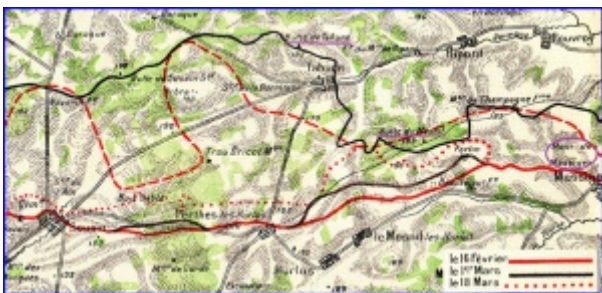
Tahure dans la Marne

Incorporé à compter du 11 août 1916. Arrivé au corps au 12 août 1916. Soldat de 2e classe le dit jour.