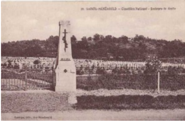
Cimetière national_ Ste Menehould

Incorporé au 31e régiment d'infanterie le 14 novembre 1904. Envoyé dans la disponibilité le 23 septembre 1905.(60)