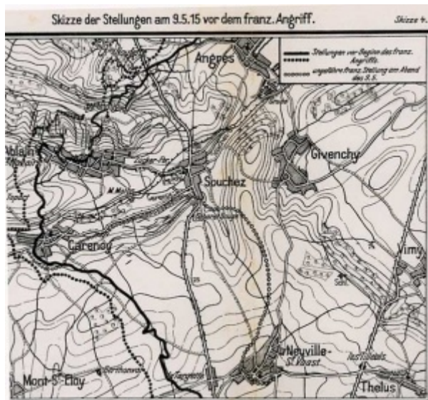
Neuville Saint Vaast (Pas de Calais)

Incorporé le 9 octobre 1911. Réformé temporairement.