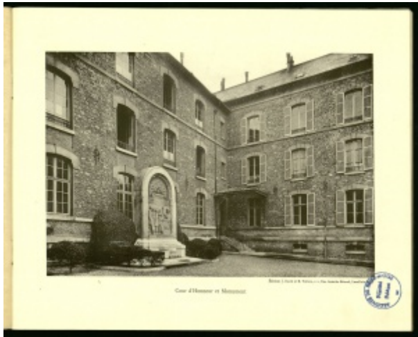
Vue du monument aux instituteurs de Seine-et-Oise tombés au champ d'honneur