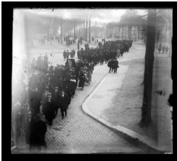
Procession des enfants de Versailles apportant la palme et les fleurs du monument aux morts, ADY, 37T421