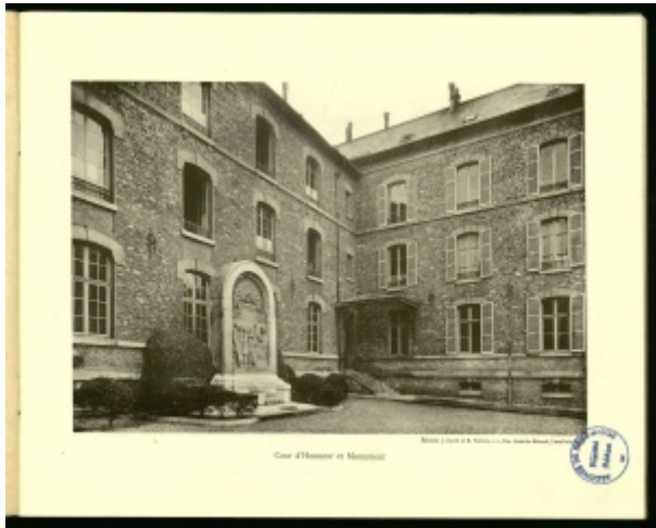
Vue du monument aux instituteurs de Seine-et-Oise tombés au champ d'honneur