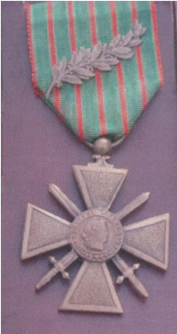
Croix de guerre d'Henri Lacroix

Le 10 février 1916, il est nommé brigadier.