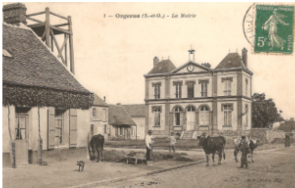
La Place des Halles d'Orgerus avant 1910