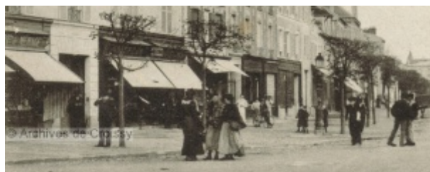
Le boulevard à la veille de la Grande Guerre.

Qui étaient nos prédécesseurs, d'où venaient-ils et que faisaient-ils ? Portrait d'une population à la veille de la Grande Guerre.