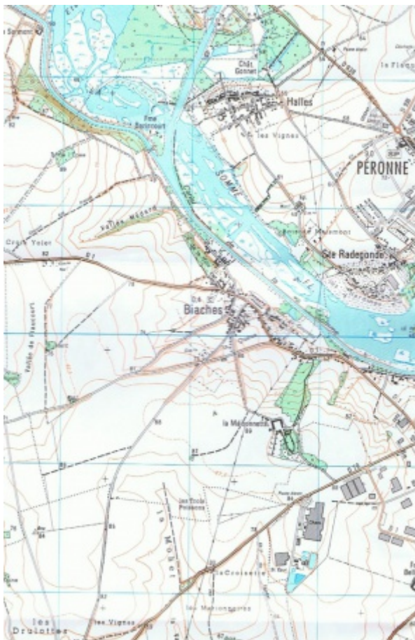
Biaches dans la Somme

Mis en route le 12 avril 1915. Arrivé au corps le 12 avril 1915