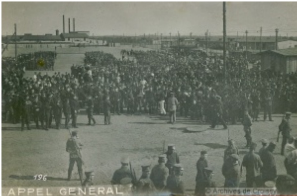
Le camp de prisonniers de Soltau en Basse-Saxe.

De Le Wiki de la Grande Guerre Aller à : navigation, rechercher