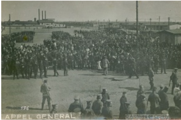
Le camp de prisonniers de Soltau en Basse-Saxe.

The printable version is no longer supported and may have rendering errors. Please update your browser bookmarks and please use the default browser print function instead.