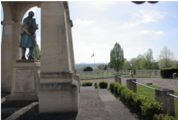
Nécropole Nationale Friscati

Engagé volontaire pour 5 ans le 9 mai 1913.