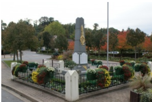
Photographie du Monument aux Morts de Buc situé place de la République