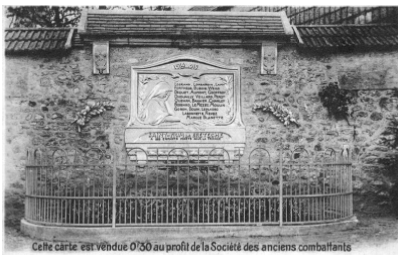
Le monument à son emplacement initial [2]