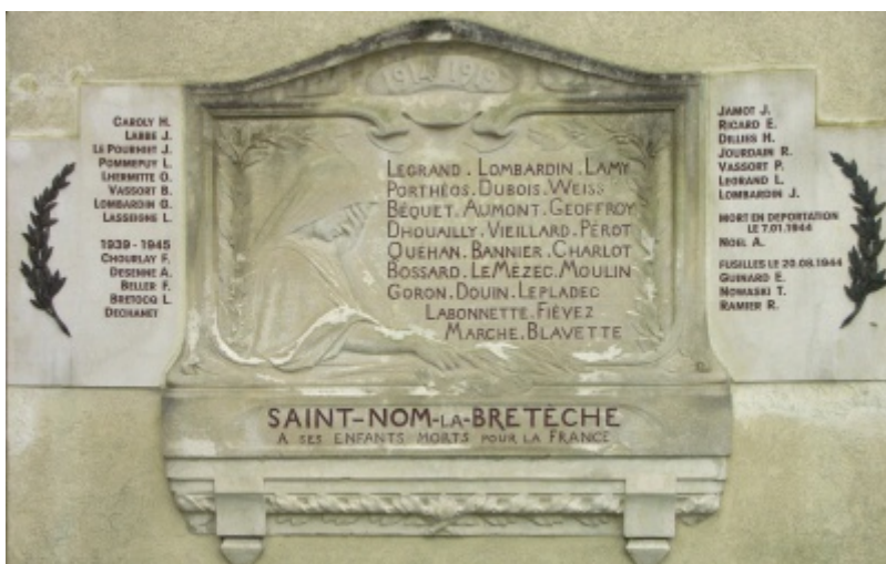
Le monument avec plaques complétées en 2007 [3]

On y ajoute les noms des soldats et des civils victimes de la guerre 1939-1945.