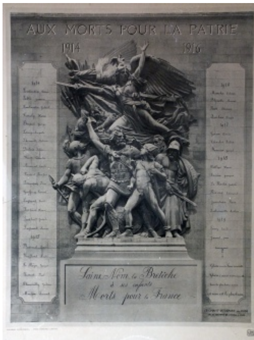
Carton avec noms manuscrits [4]