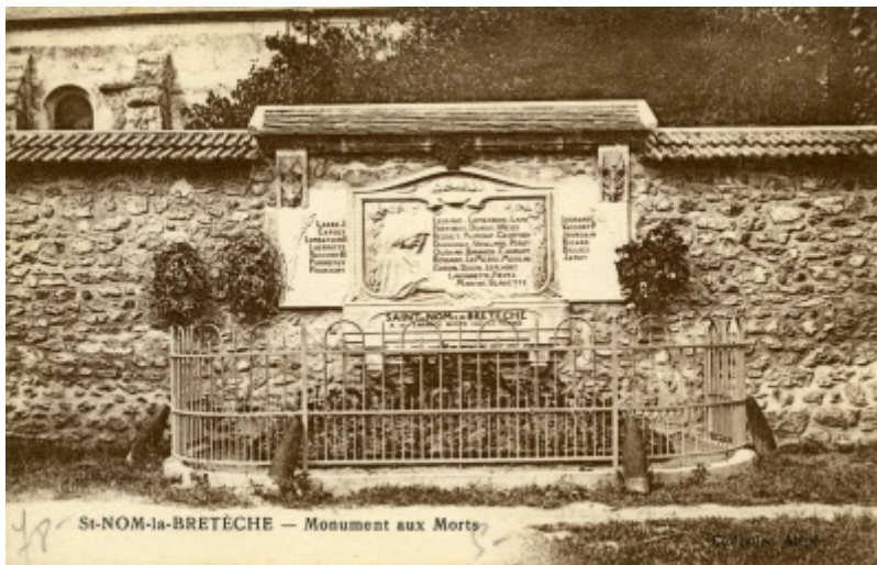
Le monument à son deuxième emplacement [2]

Le monument est inauguré le 3 août 1919 avec seulement 25 noms.