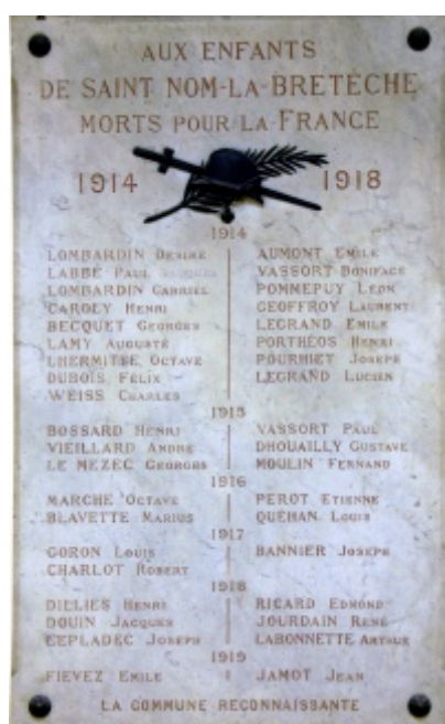
Plaque en Mairie [3]

Ces modifications résultent des recherches effectuées aux Archives communales de Saint-Nom-la-Bretèche, aux Archives des Anciens Combattants, à celles du Souvenir Français et sur le site Internet "SGA Mémoire des Hommes", du Ministère de la Défense.