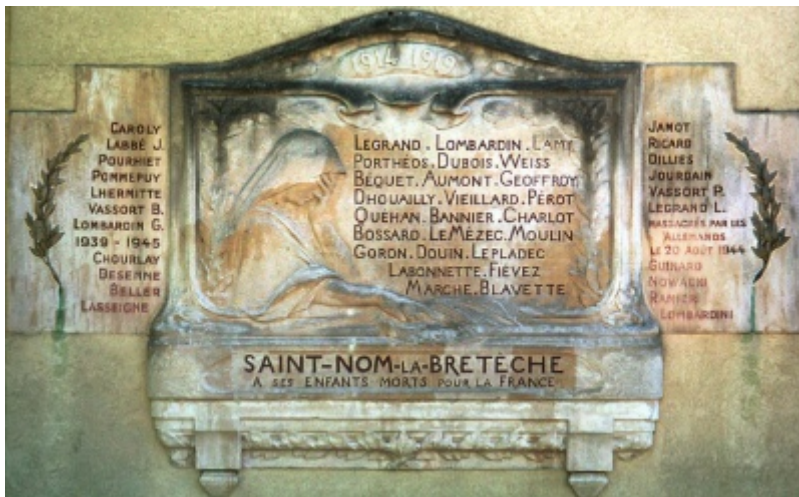
Le monument Place du Souvenir (photo de 2002) [3]