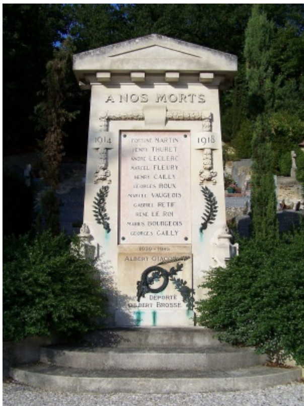
Évecquemont Monument aux morts.jpg