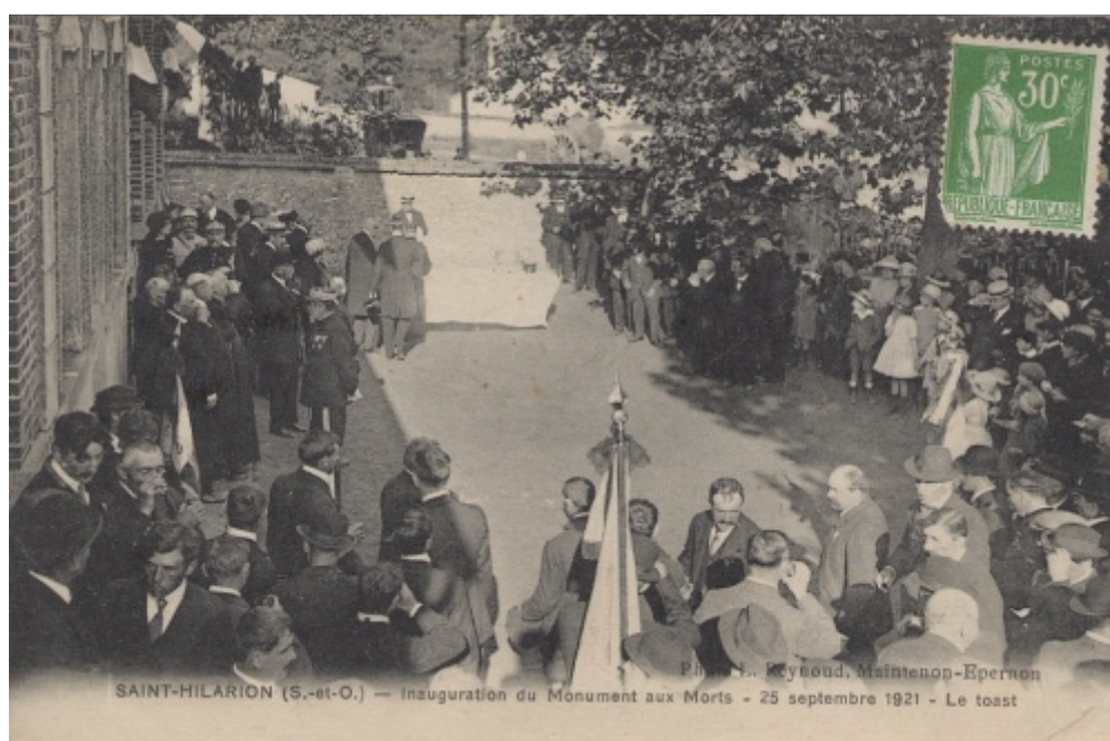
Vin d'honneur dans la cour de la mairie