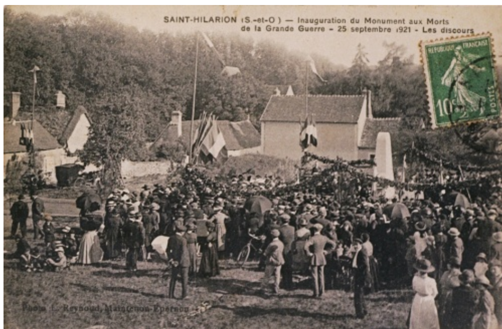
Inauguration du monument le 21/09/1921

grilles. Mais en 1968, le conseil municipal décide de supprimer les grilles.