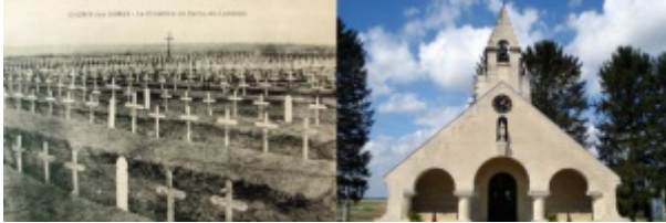
Cimetière de cerny-en-laonnais

Incorporé à compter du 12 avril 1915. Arrivé au corps le 12 avril 1915 et soldat de 2e classe le dit jour.