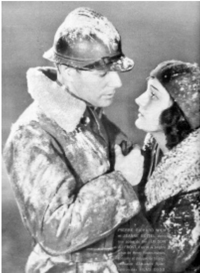
Pierre RICHARD-WILLM dans le film "Un soir au front" [2]

Pierre RICHARD-WILLM (1895-1983) [4] après avoir rejoint l'armée en 1916, devient à partir de 1925 un célèbre acteur de théâtre et de cinéma.