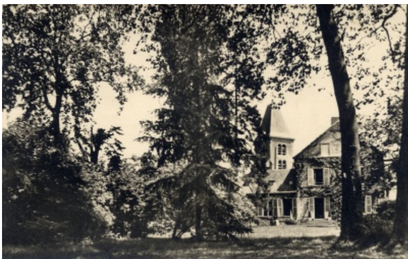
Ancienne propriété de Pierre RICHARD-WILLM à Saint-Nom-la-Bretèche [3]