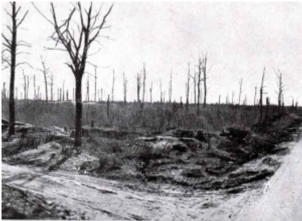
LA TRANCHÉE DE CALONNE. Départ, sur la gauche, du chemin impraticable des Éparges.