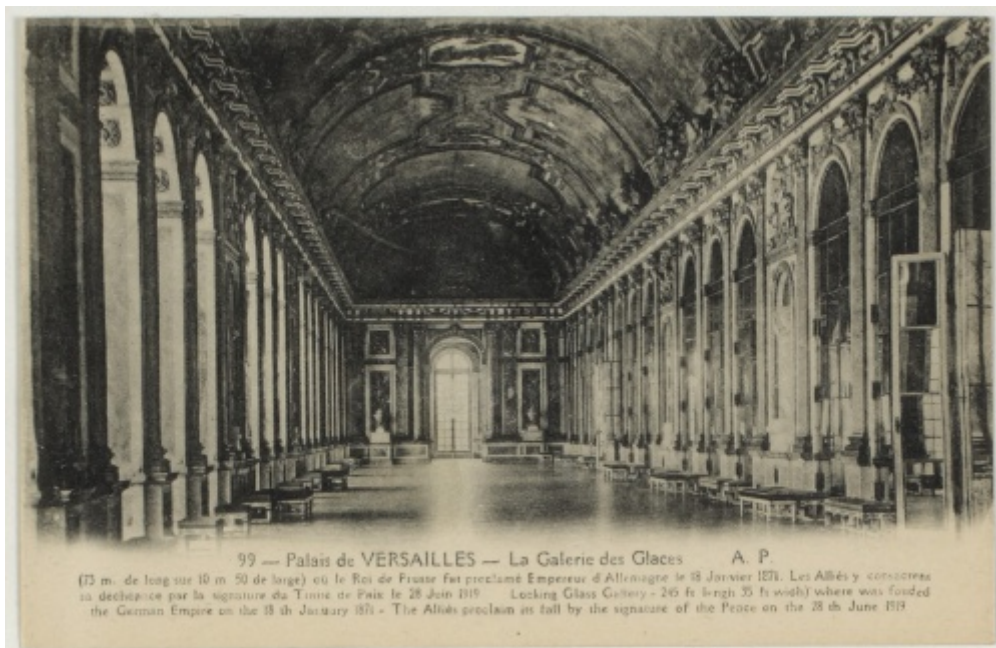
Galerie des glaces